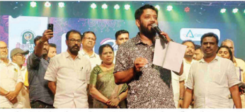
കണ്ണൂർ മുൻസിപ്പൽ കോർപ്പറേഷൻ സെക്രട്ടേറിയറ്റിലെ ഉദ്യോഗാർത്ഥന്മാർക്കായി കോർപ്പറേഷൻ ഓഫീസിൽ പ്രദർശനം നടത്തിയ ചിത്രം